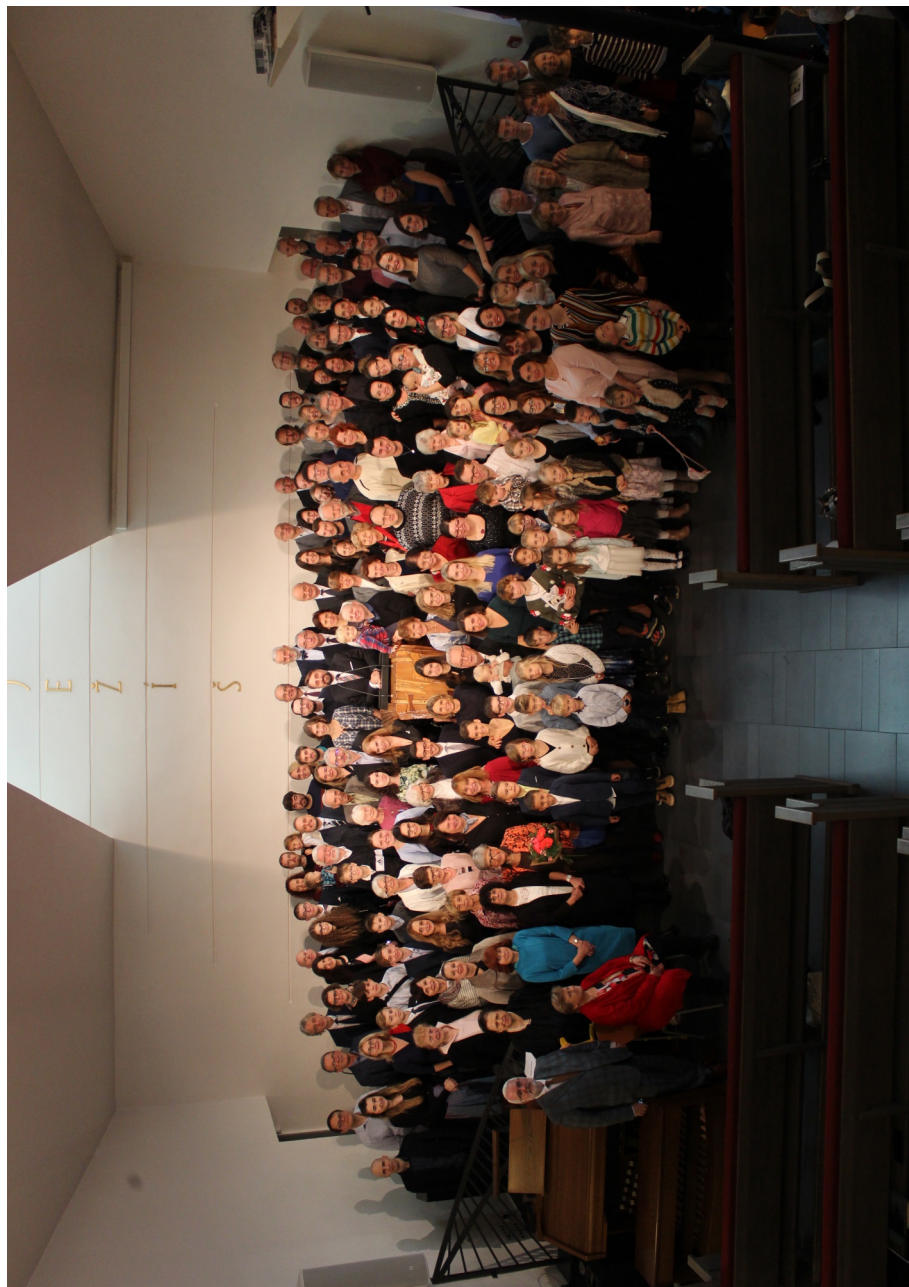
FOTO ZE 120. VÝROČÍ SBORU